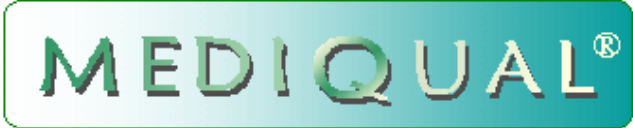
Diagramme de projet : Mise en place d'un Système de Management de la Qualité selon le programme MEDIQUAL ®